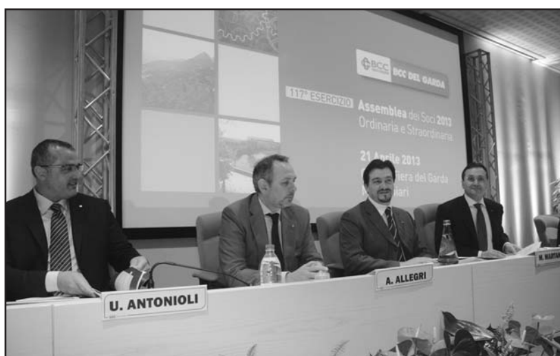
Il tavolo della presidenza all'inizio dell'assemblea.