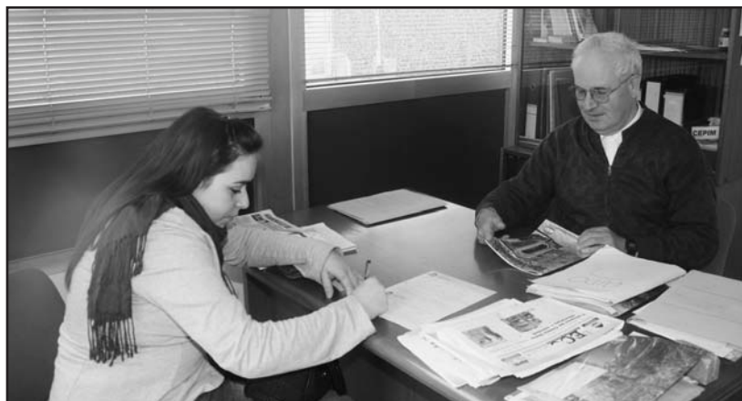
Una nuova importante iscrizione all'Aido presso la sede.

Tramite questa rubrica cercheremo di informare delle varie iniziative, tutte rivolte ad una maggiore conoscenza del problema, con un gemellaggio ideale con l'AVIS. Lo scorso anno è stato organizzato un primo appuntamento musicale con i giovani che verrà riproposto anche quest'anno a settembre. Anche quest'anno verranno proposti incontri musicali con l'Associazione Pellegrino da Montechiaro, una tradizione che ha sempre visto una nutrita partecipazione di pubblico. L'abbinata AVIS-AIDO ha già prodotto i primi interessanti risultati, oltre alle ade-