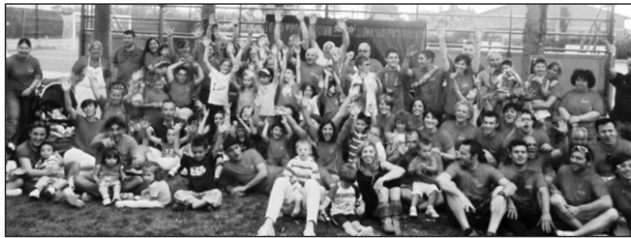
Foto ricordo festa 2012.