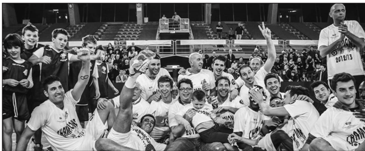
Euforia per la meritata certezza della promozione in B2.

Dopo la Coppa Italia vittoria in Campionato di C1