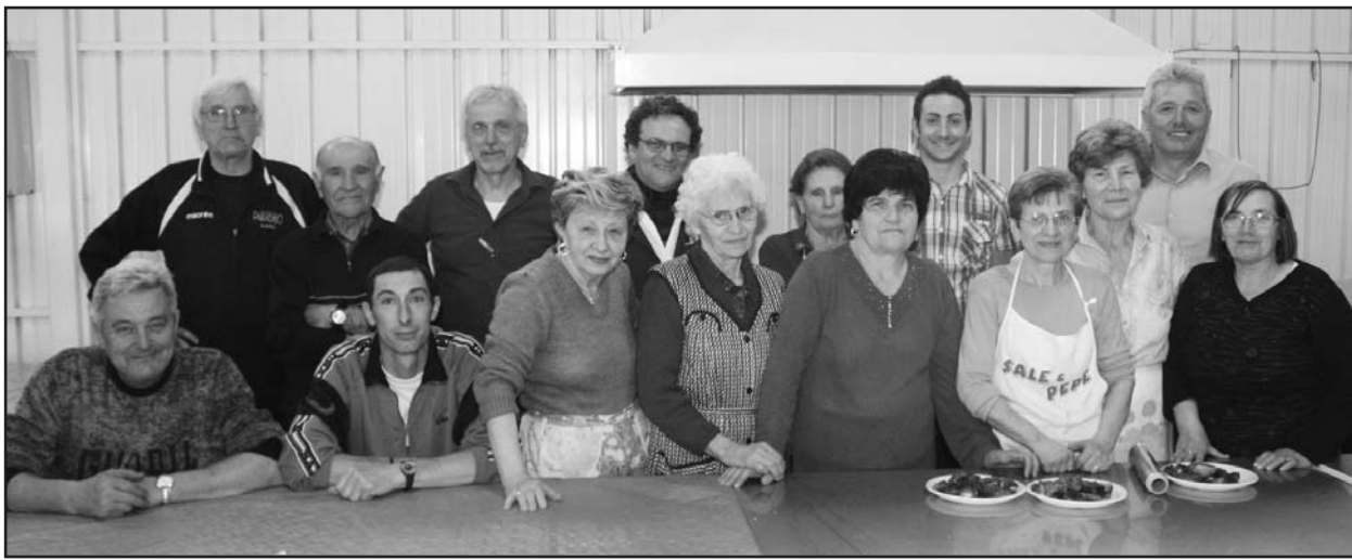
Alcuni componenti dell'organizzazione dell'Associazione Vittorio Pezzaioli dei Trivellini.