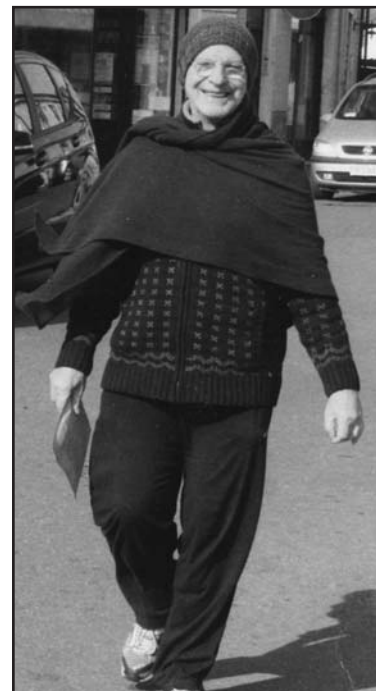
Aldo Busi per le vie di Montichiari.